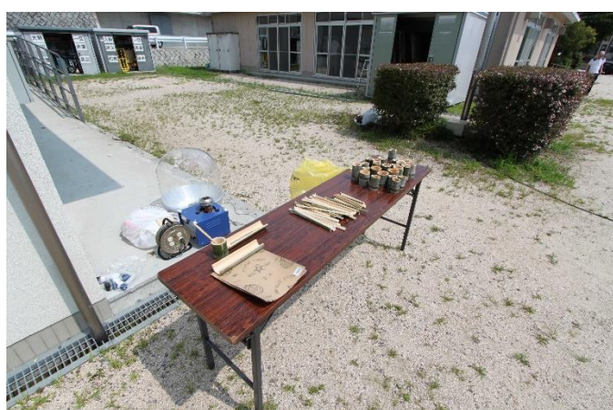
流しそうめんの前準備 台作り、椀作り、箸の竹材作り