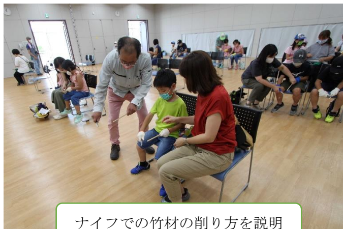
ナイフでの竹材の削り方を説明