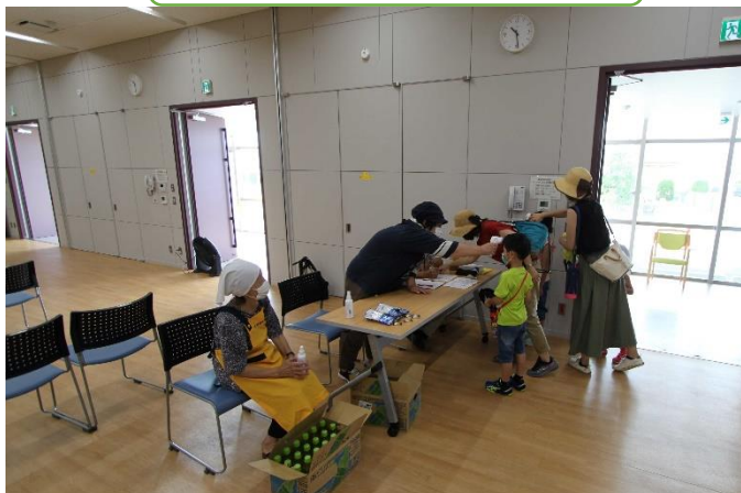
受付で記帳、検温、手の消毒