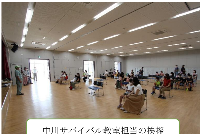
中川サバイバル教室担当の挨拶