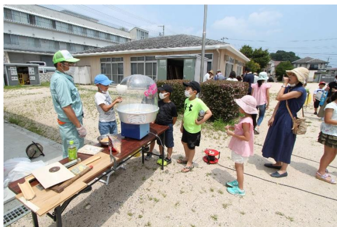
綿菓子作りを体験 大きく出来ています